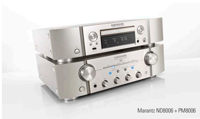
Marantz ND8006 + PM8006

D&M Germany GmbH A Division of Sound United An der Kleinbahn 18 41334 Nettetal Deutschland